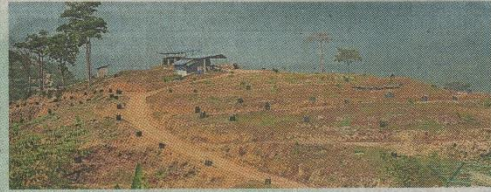
一些买家已在土地上进行种植,再多几年就可以享受成果了。

他强调,高峰峪重视环保,在开发土地时尽量保留一些树木,甚至重新种植,绿化环境,保护大自然生态。