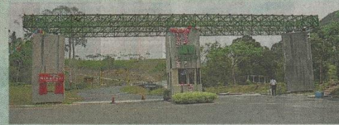
高峰集团在加叻文积路开辟的高峰峪,让人们打造田园生活的新体验。