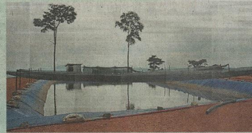
山坡上兴建大水池,让买家可以随时灌溉农作物。