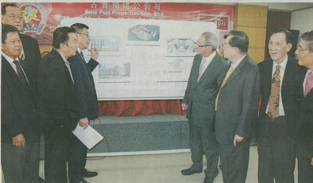
众人参观发展蓝图。

(本报古晋18日讯) 古晋福建公会与高峰产业有限公司今日签署协议书，以联营的方式，发展位於甘蔗园路/敦亚志奥本路的义山地段！