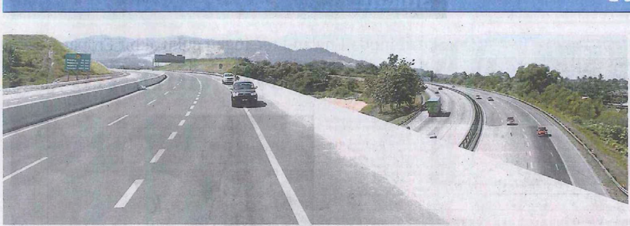
LEBUHRAYA KL-Kuala Selangor bermula di Taman Templer, di Lembah Klang dan tamat di Ijok, Selangor akan dirasmikan oleh Shaziman Abu Mansor tidak lama lagi.

Newspaper : Utusan Malaysia Date : 21st June 2011 Title : 60,000 pengguna sehari Section : Utusan Kota Page : 31