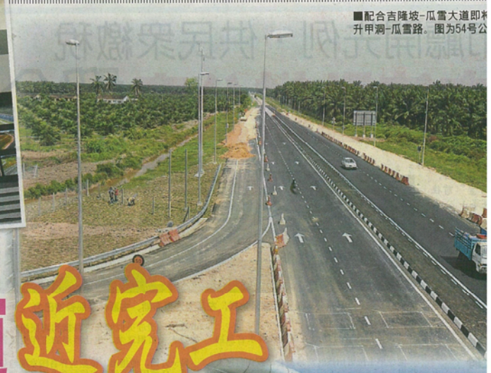
配合吉隆坡-瓜雪大道即将升甲洞-瓜雪路。图为54号公路。