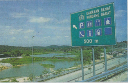
人士休息及用餐。大道内设有各种服务的休息站, 让驾驶